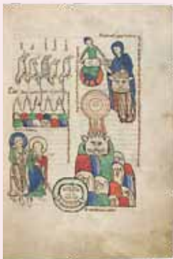
Miniatur aus dem Rupertsberger Codex des Liber Scivias

DIENSTAG, 29. NOVEMBER 2011 , 19 UHR, DOM ST. BARTHOLOMÄUS, DOMPLATZ 14