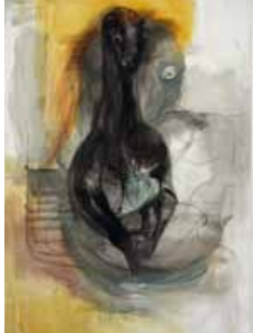
Christa Näher, „Gespenst“, 2006, Öl auf Leinwand

DONNERSTAG, 19. JANUAR 2012, 19 UHR, STÄDELSCHULE, DÜRERSTRASSE 10