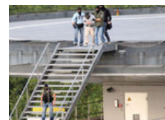
Polizeiaufgebot beim Prozess um Sauerlandterroristen