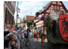
Kerb in Niederursel