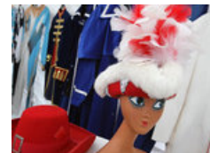
Konfetti-Messe in Frankfurt