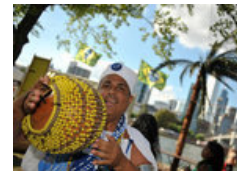
Impressionen vom Museumsuferfest